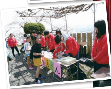
和歌山県立伊都中央高等学校 入学式